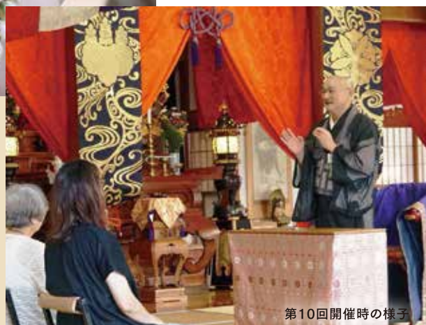
第10回開催時の様子