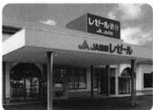
JA紅のホール レゼール追分 TEL.018-872-1890

※お電話に対応できない場合があります。留守電にメッセージをお願い致します。 ※お電話でのご相談は承っておりません。