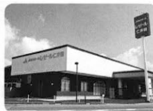
JA紅のホール レゼール仁井田 TEL.018-839-5550