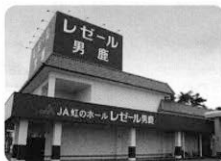
JA紅のホール レゼール男鹿 TEL.0185-35-4949