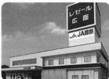
JA紅のホール レゼール広面 TEL.018-884-7236